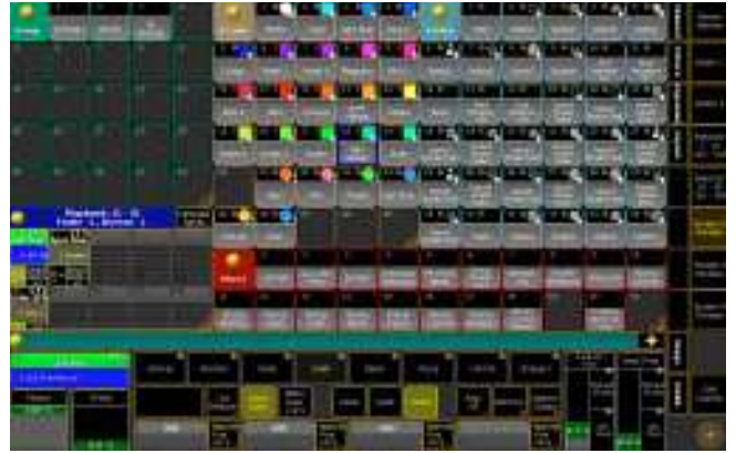
Grupos, Presets e Playbacks