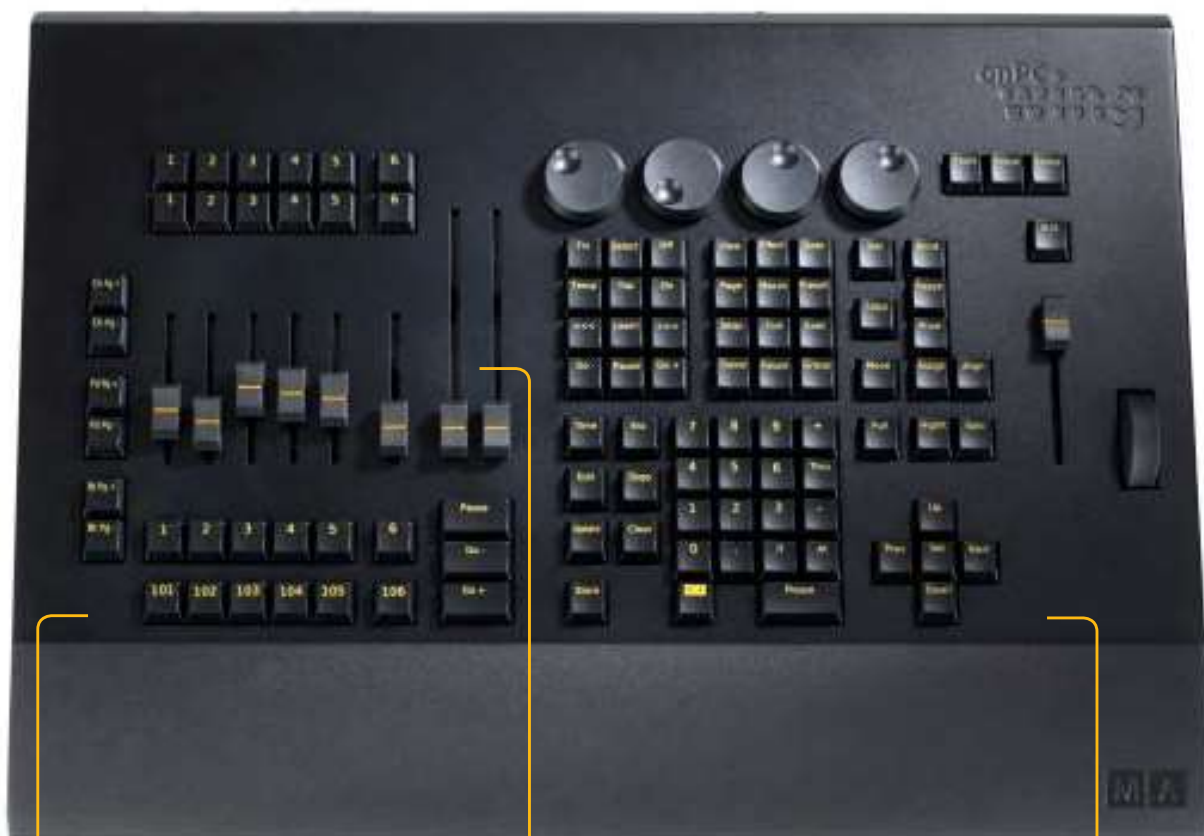
MA onPC command wing