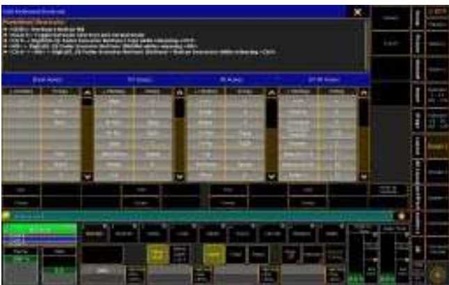
Menu de Atalhos de teclado

O software grandMA2 onPC é tão flexível como o software dos consoles grandMA2. De fato é exatamente o mesmo software mais com características adicionais que refletem o hardware dos consoles grandMA2 possibilitando maior comodidade na sua operação. Assim poderá acessar a cada seção dos consoles desde o software via os botões específicos, para trabalhar da mesma forma que o faria sentado no seu console grandMA2