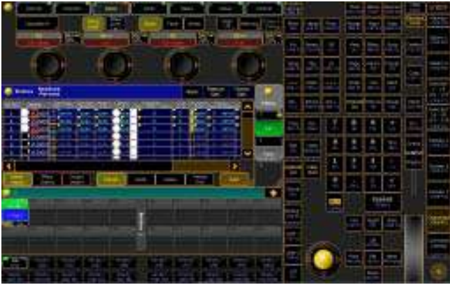
Atalhos de teclado para Grupos